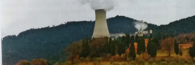
L'impianto di Larderello. ▼