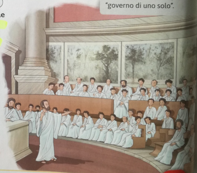
Una seduta del Senato romano. ▶

I senatori collaboravano con il sovrano per stabilire le leggi e amministrare la giustizia. Inoltre, organizzavano cerimonie religiose e feste civili.