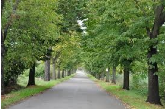
viale di tigli