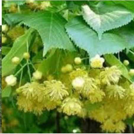
foglie di tiglio